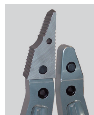
プッシュボタン式先端チップ