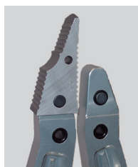
プッシュボタン式先端チップ